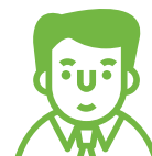
Трудоспособное население/родители (25-55 лет)

Жизненные приоритеты – карьерный рост, при этом – работа в удовольствие (в ущерб стабильности), гибкий график