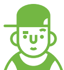
Школьники (7-17 лет)

Поколение «растущих в сети», которое часто уже не видят больших различий между миром реальным и виртуальным