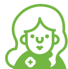
Молодежь (17-30 лет)

Жизненные приоритеты – новые эмоции и впечатления (в ущерб комфорту, стабильности, карьере и другим традиционным ценностям предыдущих поколений)